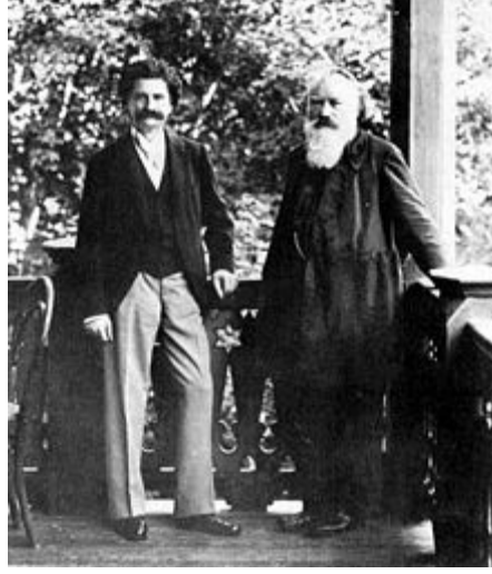
برامس مع يوهان سترابوس الابن

وفي سنة 1859 قدم كونشرتو البيانو الأول واختلفت حوله الآراء كثيراً وبعد فترة انتقل إلى سويسرا حيث أقام سنتين ووجد ناشراً لمؤلفاته وطلبة عديدة له. وفي سنة 1862 عاد إلى فيينا ليستقر فيها نهائياً بعد أن قدم كثيراً من أعماله وتوطد مركزه الموسيقي. كان برامس إنساناً بسيطاً لا يسعى وراء الدعاية لنفسه أو لأعماله يحب الطبيعة ويحب مجالسة الأصدقاء ولكن على شرط ألا يشغلوا وقته عن التأمل والتفكير فيما يكتب. وفي سنة 1897 تُوفي برامس بسرطان الكبد بعد صراع مرير مع هذا المرض.